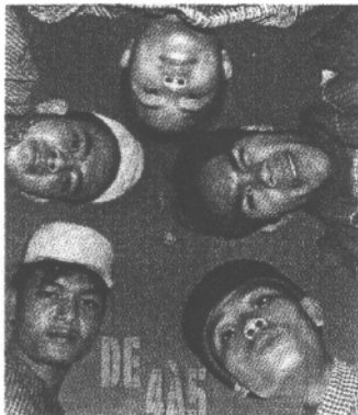
Circus Phare Ponleu Selpak

Eine Zirkusschule aus Kamboodscha ist einer der Abräumer der Saison. Phare Ponleu Selpak Cirk heißt ein Projekt, das mit französischer Hilfe (Collectif clowns d'ailleurs et d'ici) Kindern, die aus Flüchtlingslagern in Thailand in ihre kambodschanische Heimat zurückkehren, eine umfassende Ausbildung bietet, die auch Zirkuskünste und Kunstgeschichte enthält. Ein Rettungsan-